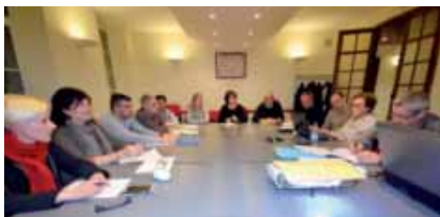
Le Conseil Municipal

Afin de pouvoir tenir la liste électorale à jour, il est demandé aux administrés de signaler systématiquement leur changement d'adresse, changement de situation familiale (ex : départ du foyer des enfants majeurs,...).